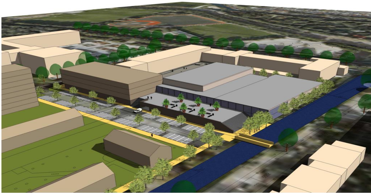
SPORTHAL - VOGELVLUCHT TOTAALBEELD